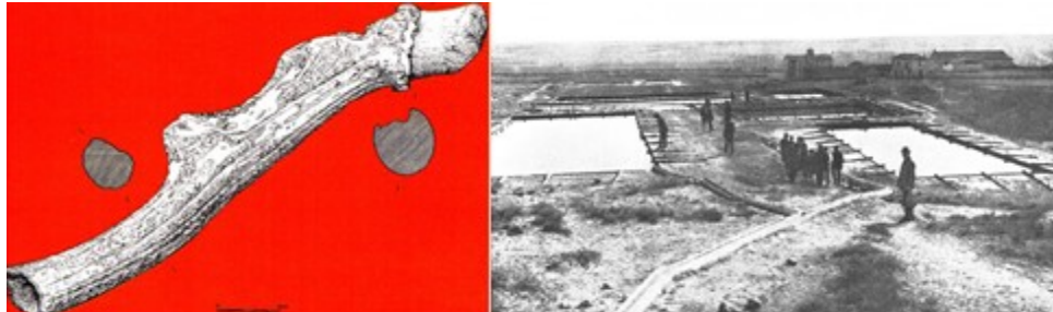
Pico-palanca, mina calcolítica del Milagro, Onís (Asturias) y Visita a las Salinas Espartinas con motivo del Congreso Geológico Internacional de 1926

Ciempozuelos (Madrid) 4 al 7 Noviembre 2021