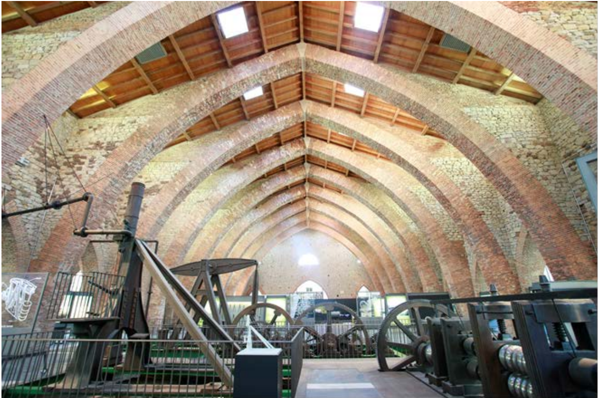
Interior de las instalaciones del MSM

del MSM, además de 2 castilletes mineros, uno de ellos con más de un siglo de antigüedad, y numerosos restos de la minería reciente, que estuvo en actividad hasta la década de los 90.