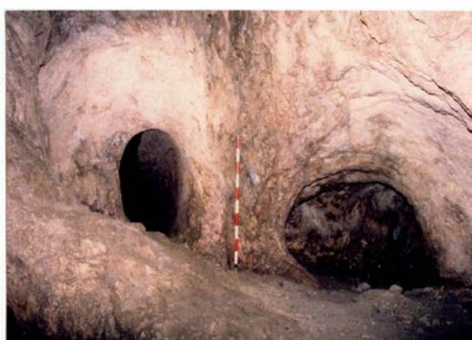
Labores prehistóricas de la mina “La Profunda” Villamanín-Cármenes (León)

“Los inicios de la metalurgia histórica en la Península Ibérica”