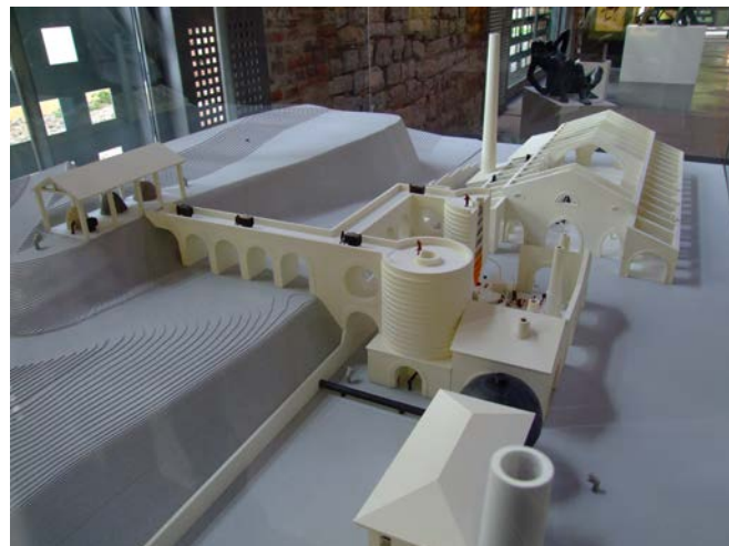
Maqueta de las instalaciones siderúrgicas de la Palentina Leonesa de Minas

El Congreso tendrá lugar en la localidad de Sabero (León) en las magníficas instalaciones del Museo de la Siderurgia y la Minería de Castilla y León, entre los días 21 y 24 de septiembre de 2023.